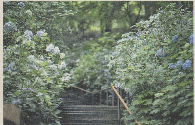
アジサイ 6月中旬~7月下旬

※写真はイメージです ※内容は変更となる場合がございます ※表記金額は全て税込です ※イベントの詳細はホームページをご覧ください