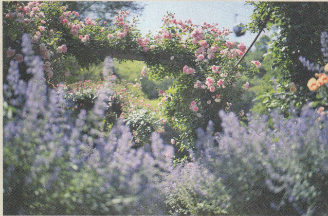
ローズ 5月中旬~6月下旬 ラベンダー 5月下旬~7月上旬